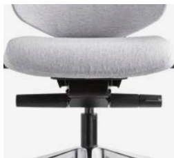
– Synchro Motion