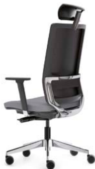
– Dossier haut avec appui-tête