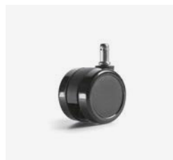
– Double galet Ø 65 mm