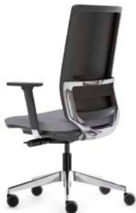
– Dossier haut