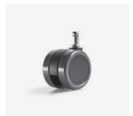
– Double galet sol dur Ø 65 mm