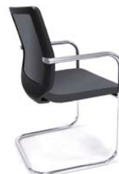
– Visiteur patin