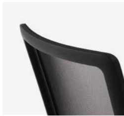
– Dossier en résille Meci