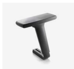
– Réglables 3D bras en polyamide