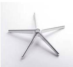
– Star 69 cm en aluminium poli