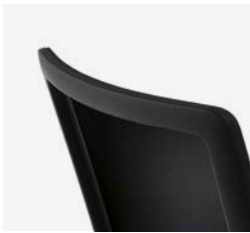
– Dossier en résille 3D