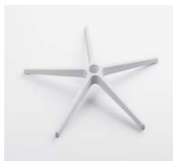
– Star 69 cm en aluminium blanc