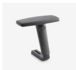
– Réglables 1D