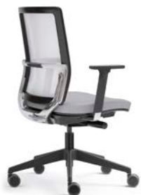
– Dossier bas