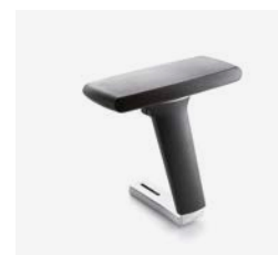
– Réglables 4D bras en aluminium