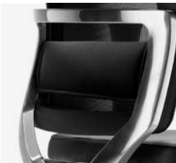
– Régulation lombaire