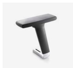
– Réglables 3D bras en aluminium