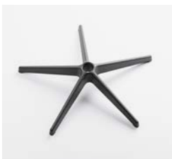
– Star 69 cm en polyamide (tabouret)