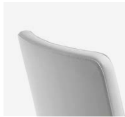
– Dossier tapissé avec mousse surinjectée