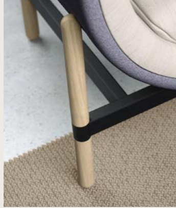
standard oak legs black powdercoated frame