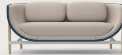
CAPSULE LOUNGE 2-SEATER