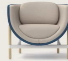
CAPSULE LOUNGE 1-SEATER