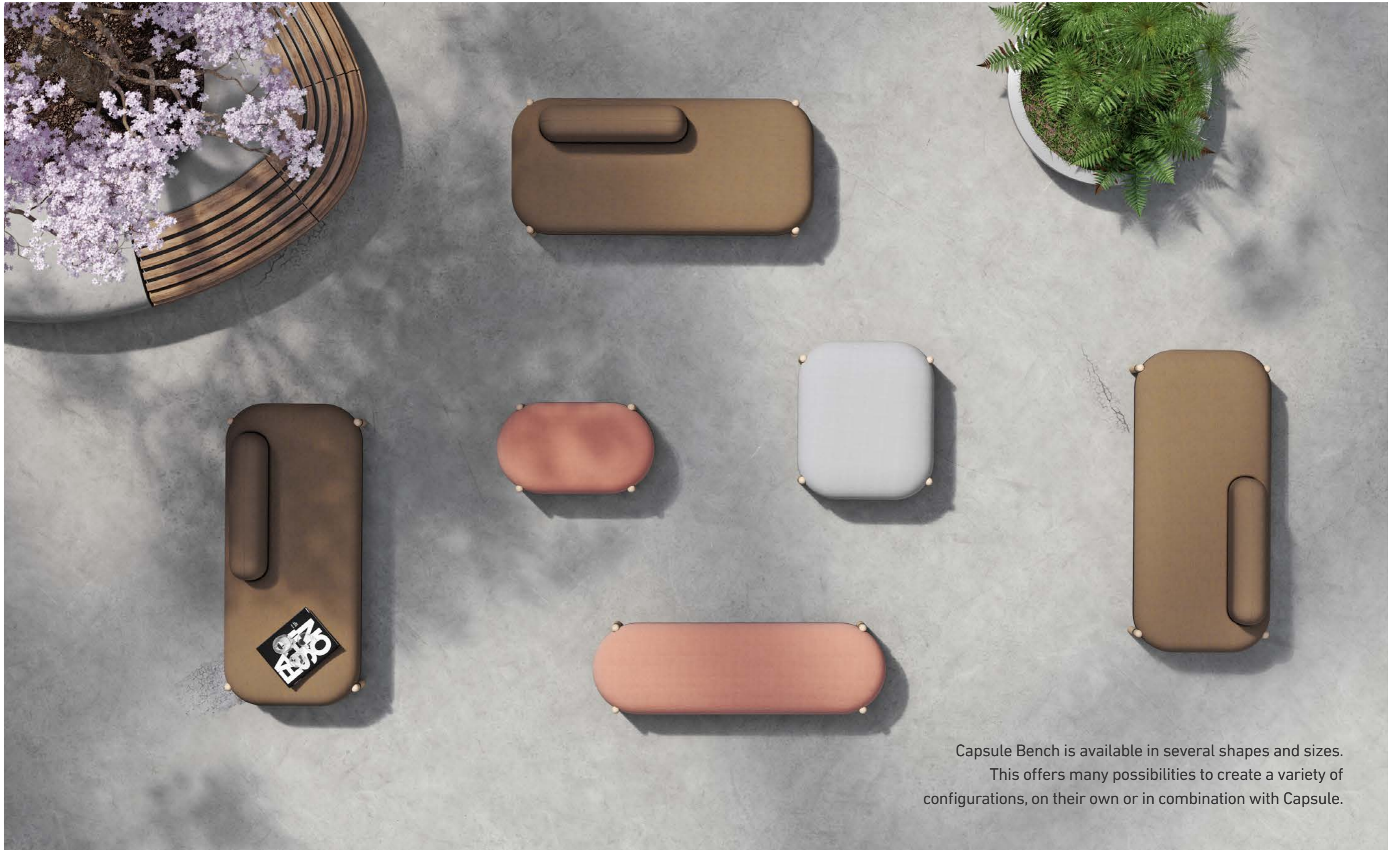
Capsule Bench is available in several shapes and sizes. This offers many possibilities to create a variety of configurations, on their own or in combination with Capsule.