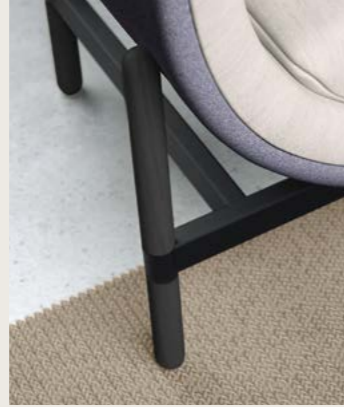
black varnished legs black powdercoated frame