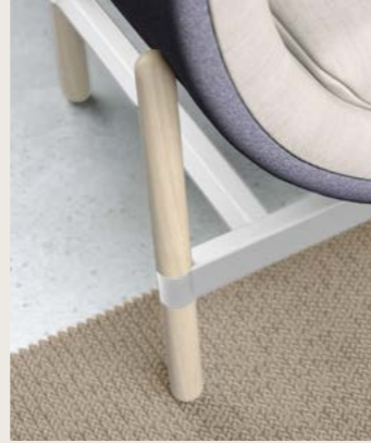
white wash oak legs white powdercoated frame

Entièrement tapissé y compris coussins d'assise et de dossier ; tapissage bicolore avec deux tissus du même groupe sans surcoût. Tissus de groupes différents sur demande.