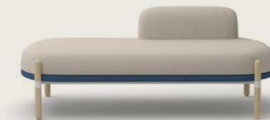
CAPSULE BENCH RIGHT/LEFT BACKREST 4236/08 - 4236/09